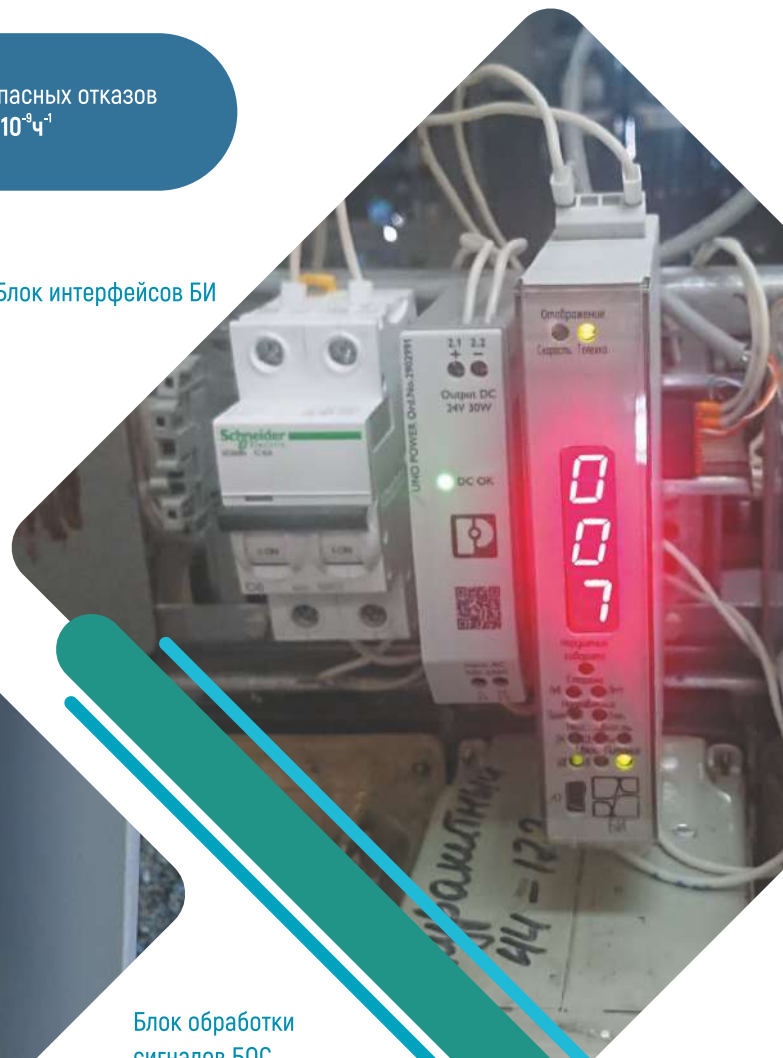
Блок обработки сигналов БОС