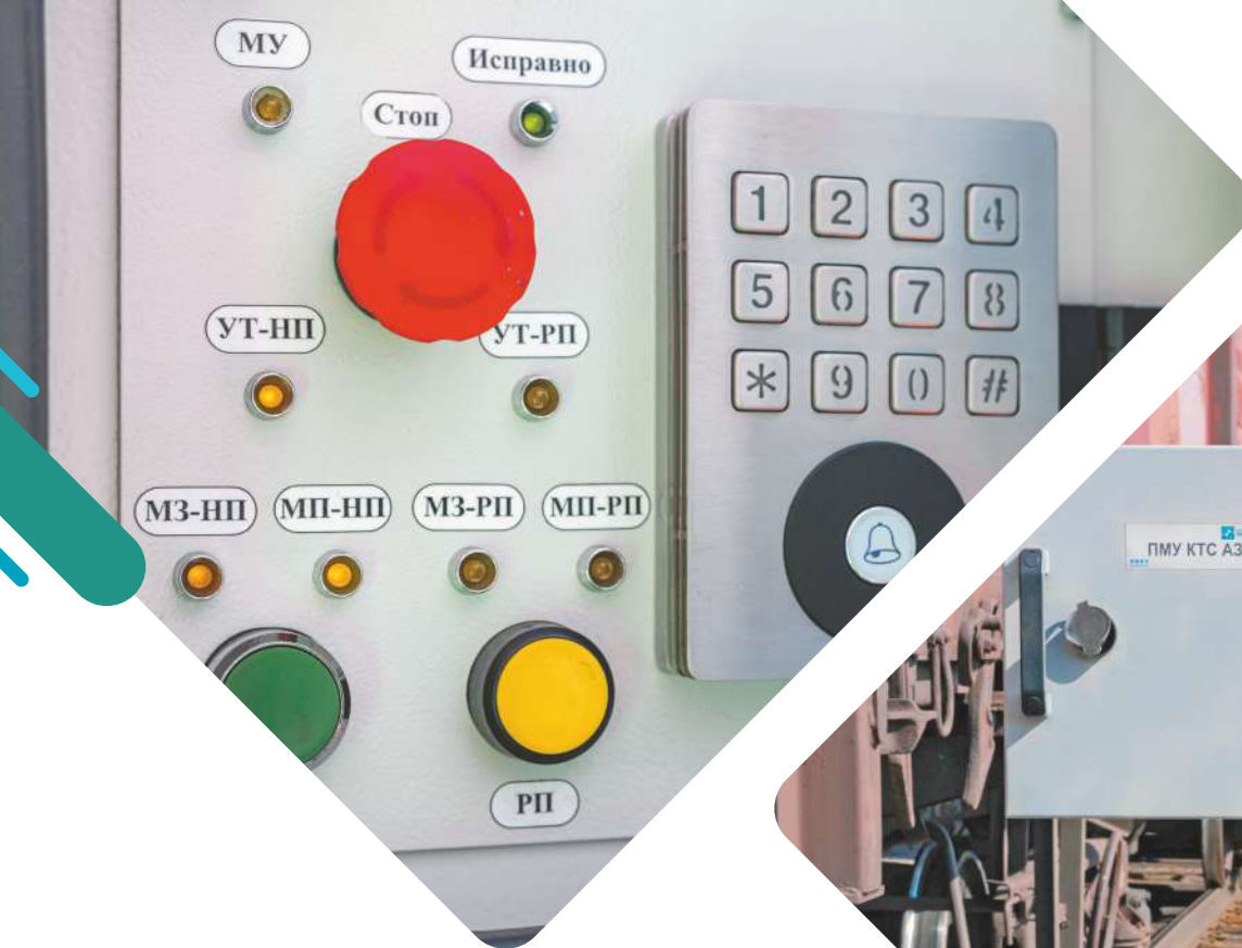
Пульт местного управления