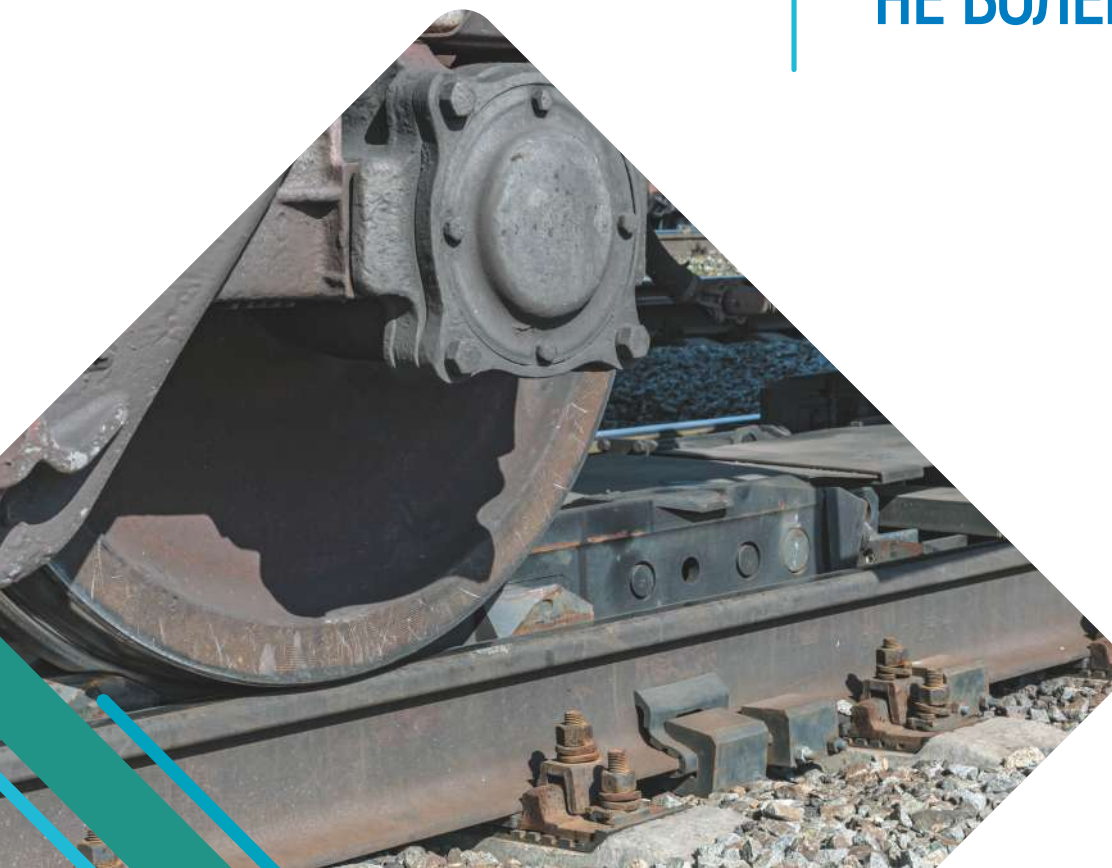
Закрепление колесной пары

ВРЕМЯ ЗАКРЕПЛЕНИЯ/СНЯТИЯ ЗАКРЕПЛЕНИЯ Поезда ТОРМОЗНЫМ УПОРОМ НЕ БОЛЕЕ 2 МИНУТ